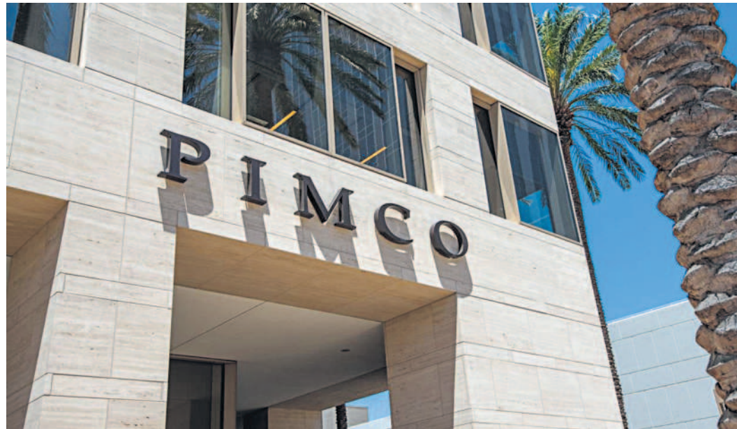
The intense jockeying that went on behind the scenes underscores the huge financial stakes behind the rise of AI and the rapid build-out of the computing and power infrastructure needed to feed chatbots.

For borrowers, private credit costs more, but is attractive because it allows them to keep a tighter leash on the process without broadly releasing information about their data centres. For lenders, it offers a